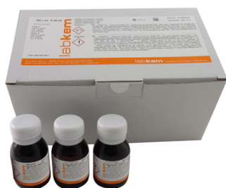
FOTO DEL PRODOTTO